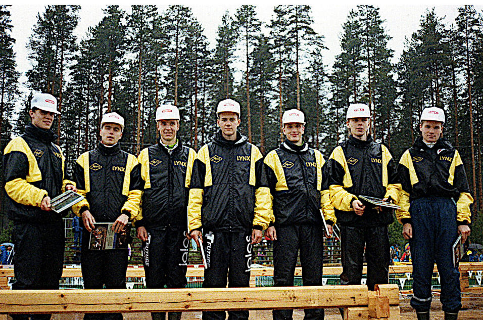
Jukolan viestissä miehet (20.) ja Venlojen viestissä naiset (12.) saavuttivat vuonna 1990 seuran siihen asti parhaat sijoitukset.